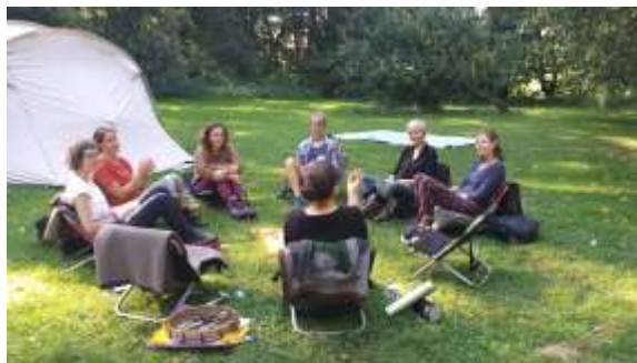
Ritualplatz in Dalborn

Zeiten der Wandlung sind oft von Ungewissheit, Sehnsucht nach Veränderung und Ängsten begleitet. Gehen wir – achtsam und respektvoll begleitet – durch sie hindurch, können wir mit den eigenen Seelenbewegungen wieder tiefer in Balance kommen. Die Schutzmauern um die Seele werden durchlässiger. Wir spüren, dass wir eingebettet sind in einen umfassenden Prozess des Lebendigen, das sich entfalten will.