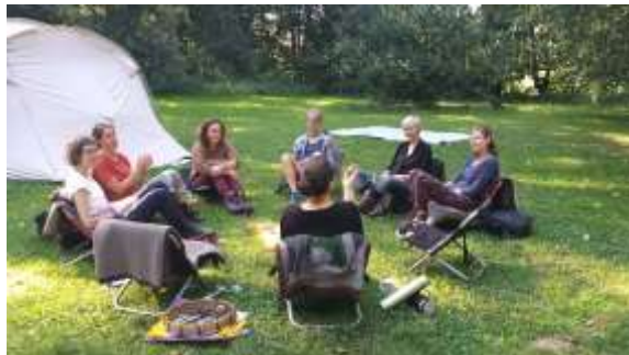
Ritualplatz in Dalborn

Zeiten der Wandlung sind oft von Ungewissheit, Sehnsucht nach Veränderung und Ängsten begleitet. Gehen wir – achtsam und respektvoll begleitet – durch sie hindurch, können wir mit den eigenen Seelenbewegungen wieder tiefer in Balance kommen. Die Schutzmauern um die Seele werden durchlässiger. Wir spüren, dass wir eingebettet sind in einen umfassenden Prozess des Lebendigen, das sich entfalten will.