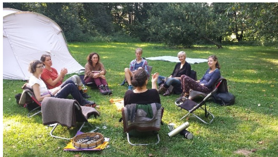
Ritualplatz in Dalborn

Zeiten der Wandlung sind oft von Ungewissheit, Sehnsucht nach Veränderung und Ängsten begleitet. Gehen wir – achtsam und respektvoll begleitet – durch sie hindurch, können wir mit den eigenen Seelenbewegungen wieder tiefer in Balance kommen. Die Schutzmauern um die Seele werden durchlässiger. Wir spüren, dass wir eingebettet sind in einen umfassenden Prozess des Lebendigen, das sich entfalten will.